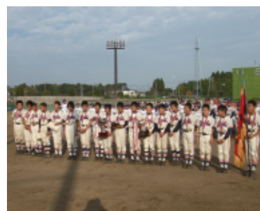
ろうきん少年(学童)野球大会(千葉地区)