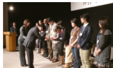
助成プログラムパートナーミーティング(贈呈式)

ファクシミリとインターネットを活用して、〈中央ろうきん〉の活動報告、労働組合や生協などの社会貢献活動や、NPO活動の紹介などの各種情報を無料でお届けするサービスです。(送付先:労働組合・NPO・個人など884先/2011年3月末現在)