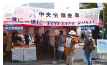
アースデイブース