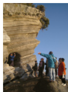
特定非営利活動法人 たてやま海辺の鑑定団