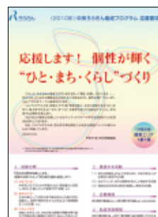
助成プログラム応募要項