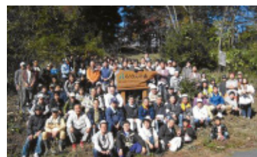
森林ボランティア(群馬地区)