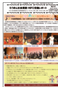
社会貢献・NPO活動レポート