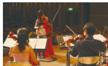
ふれあいコンサート ときどき企画(山梨地区)