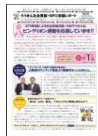
ろうきん社会貢献・ NPO活動レポート

ファクシミリとインターネットを活用して、〈中央ろうきん〉の活動報告、労働組合や生協などの社会貢献活動や、NPO活動の紹介などの各種情報を無料でお届けするサービスです。(送付先：労働組合・NPO・個人など887先/2014年3月末現在)