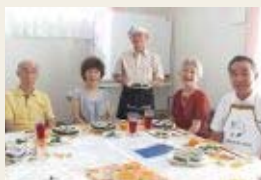
特定非営利活動法人 杉並介護応援団