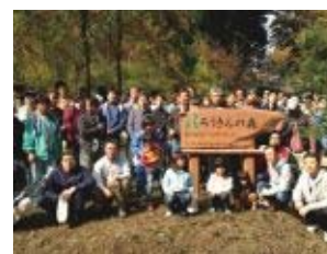
群馬地区 森林ボランティア