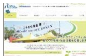
社会貢献サイト ろうきん「いきいきコミュニティ」