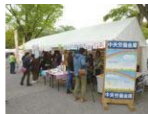
アースデイ東京2013 中央ろうきんブース