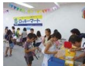
つくば市民大学イベント