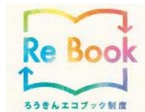
Re Book ロゴマーク

〈中央ろうきん〉と会員である労働組合・生活協同組合とその組合員の皆様がともに取り組む、新しい社会貢献の仕組みとして、2010年6月に創設しました。おもに知的障がいのある方や、自閉症の症状を抱えた方々が行う本のネット販売事業を支援する取組です。2013年度は、会員の皆様、金庫役職員から寄せられた17,777冊を寄贈しました。