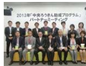
助成プログラムパートナーミーティング(贈呈式)