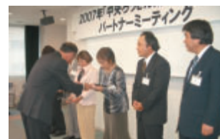
助成プログラム パートナーミーティング(贈呈式)