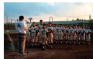
ろうきん少年(学童)野球大会