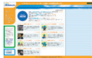
社会貢献サイト「いきいきコミュニティ」