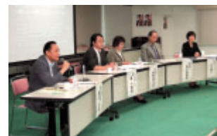
シンポジウム パネルディスカッション