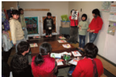
2007年助成対象団体 羽黒ほっとサロン