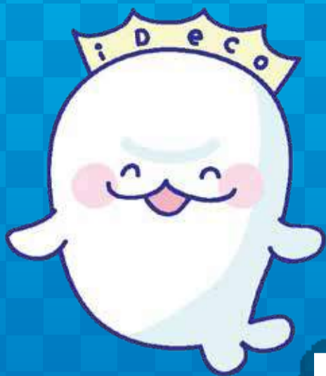
iDeCo普及推進キャラクター イデコちゃん