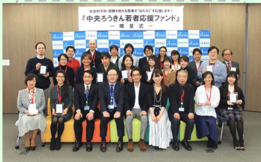
若者応援ファンド2018 贈呈式の様子