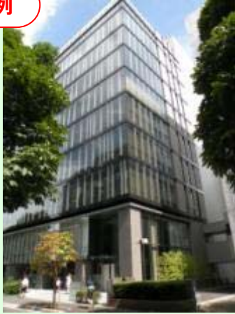
事務所外観（中央ろうきん本店）