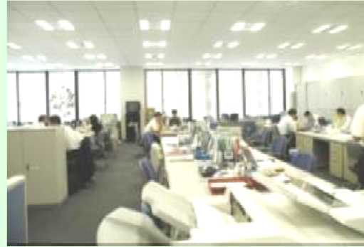
執務室の様子（常時〇名が在室）